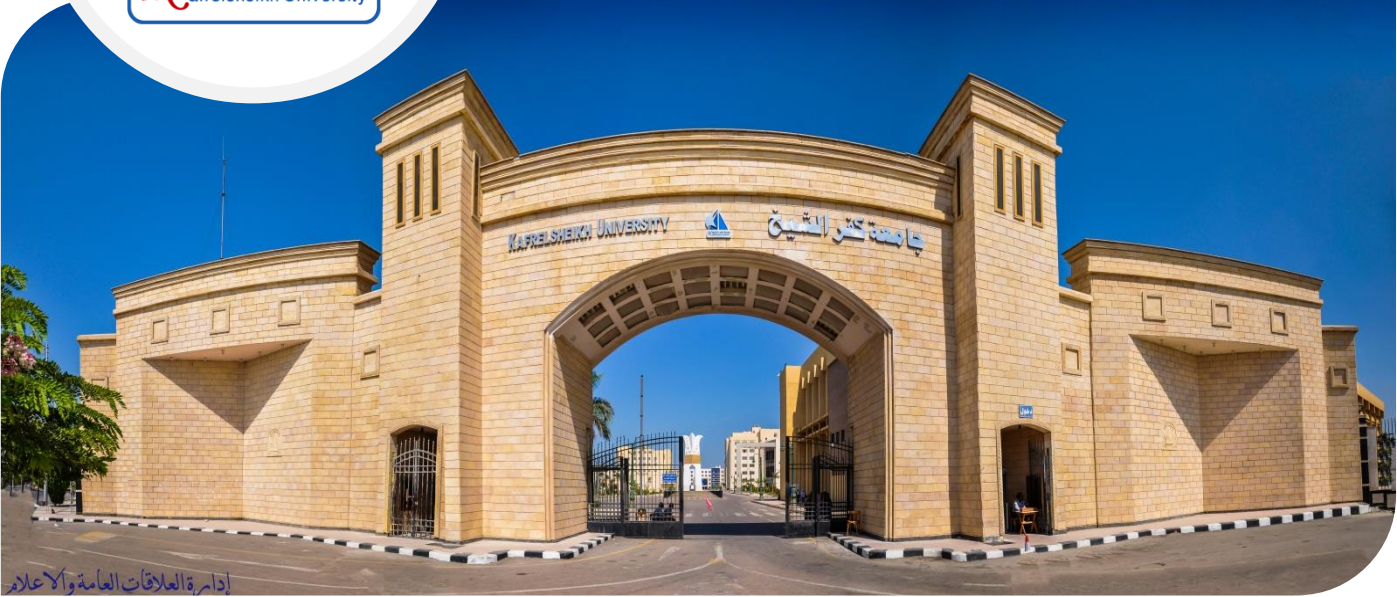
إدارة العلاقات العامة والإعلام

شارع الجيش - كفر الشيخ - جمهورية مصر العربية