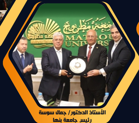
الأستاذ الدكتور / جمال سوسة رئيس جامعة بنها