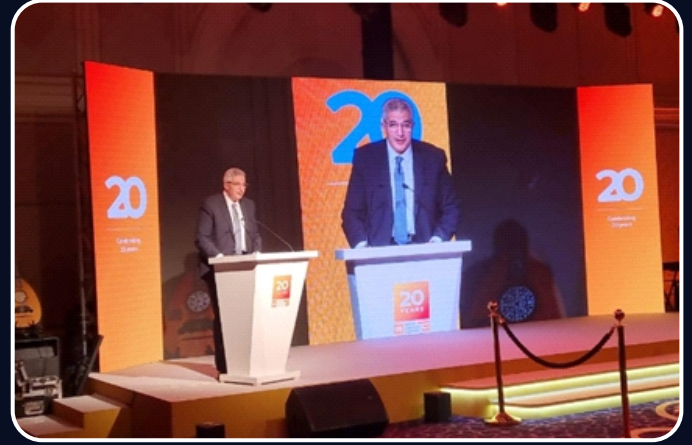
مشاركة أمين المجلس الأعلى للجامعات الأستاذ الدكتور مصطفى رفعت احتفالية مؤسسة QS البريطانية العالمية لتصنيف الجامعات لعام ٢٠٢٤.