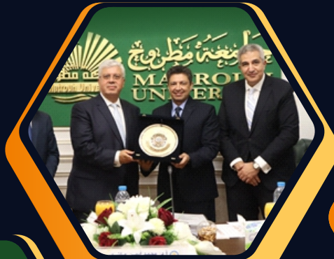
الأستاذ الدكتور / محمد دعور رئيس جامعة دمياط