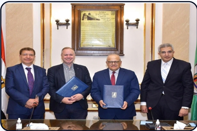
شهد الأستاذ الدكتور / مصطفى رفعت أمين المجلس الأعلى للجامعات توقيع بروتوكول تعاون للدرجات العلمية المزدوجة بين جامعة القاهرة وجامعة ايسست لندن البريطانية.