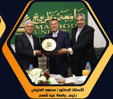
الأستاذ الدكتور / محمود المتيني رئيس جامعة عين شمس