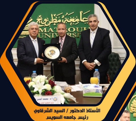
الأستاذ الدكتور / السيد الشرقاوي رئيس جامعة السويس