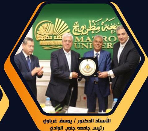
الأستاذ الدكتور / يوسف غرباوي رئيس جامعة جنوب الوادي