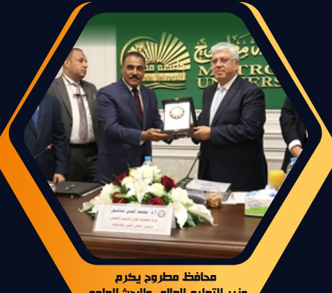
محافظ مطروح يكرم وزير التعليم العالي والبحث العلمي

وهم ( الأستاذ الدكتور / السيد الشرقاوي، رئيس جامعة السويس، والأستاذ الدكتور / السيد دعور، رئيس جامعة دمياط، والأستاذ الدكتور محمود المتيني، رئيس جامعة عين شمس، والأستاذ الدكتور / يوسف عرباوي، رئيس جامعة جنوب الوادي، والأستاذ الدكتور / جمال سوسة، رئيس جامعة بنها، والأستاذ الدكتور / مصطفى عبد الخالق، رئيس جامعة سوهاج )، وثنم المجلس التطوير الذي حققه السادة رؤساء الجامعات المنتهية ولايتهم في كافة مسارات العمل الجامعي، وكان له أطيّب الأثر في الارتقاء بالتصنيف الدولي لجامعاتهم.