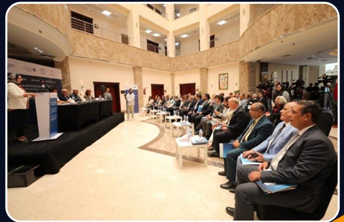
مشاركة الأستاذ الدكتور / مصطفى رفعت، أمين المجلس الأعلى للجامعات توقيع بروتوكول التعاون المشترك مع مركز تطوير التعليم (EDC).