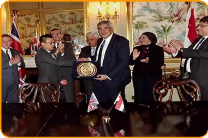
وزير التعليم العالي الأستاذ الدكتور / أيمن عاشور يشهد مراسم توقيع مذكرة تفاهم بين وزارة التعليم العالي والبحث العلمي والكلية الملكية للجراحين بأدنبرة.