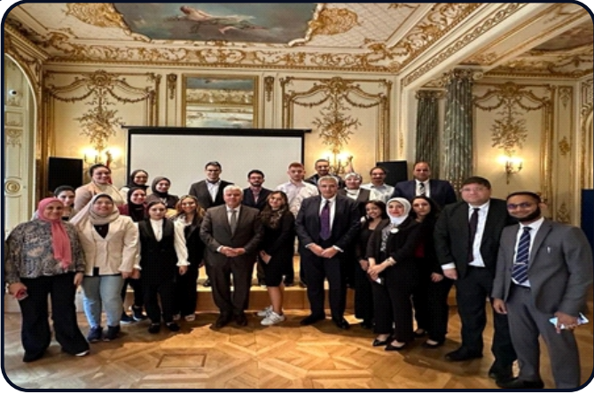
وزير التعليم العالي يلتقي بالطلاب المُبتعثين الدارسين بالمملكة المتحدة ضمن خطة البعثات وبرنامج نيوتن بحضور أمين المجلس الأعلى للجامعات