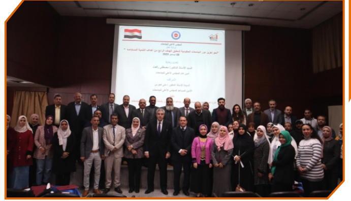
المجلس الأعلى للجامعات يعقد ورشة عمل نحو تعزيز دور الجامعات الحكومية لتحقيق الهدف الرابع من أهداف التنمية المستدامة.