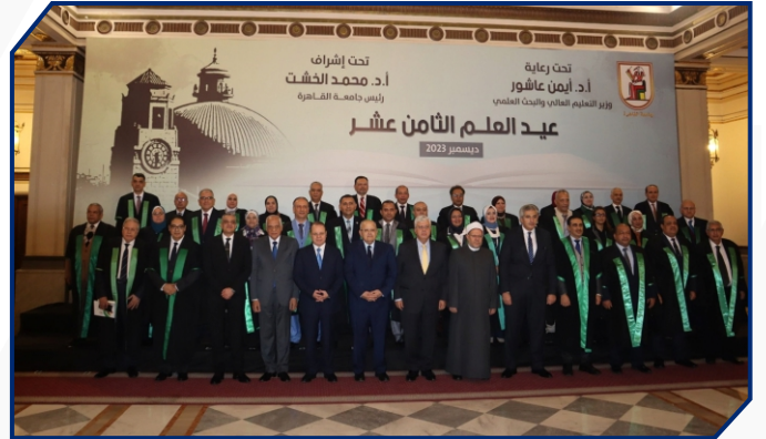
أمين المجلس الأعلى للجامعات يشهد احتفالية جامعة القاهرة بعيد العلم