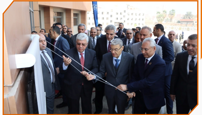
وزير التعليم العالي يفتتح عددًا من المشروعات الصحية والتعليمية بجامعة المنيا بمشاركة أمين المجلس الأعلى للجامعات