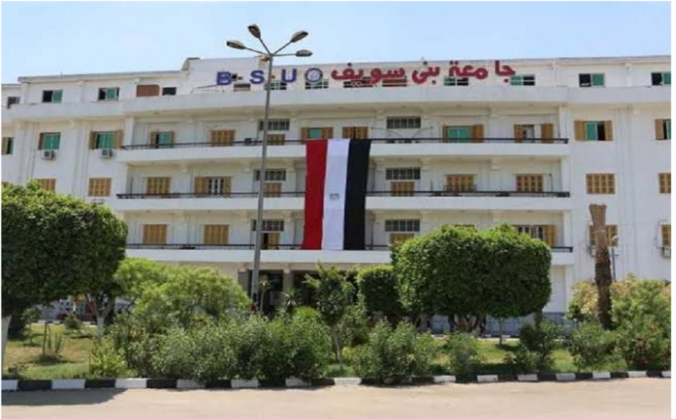
جامعة بني سويف