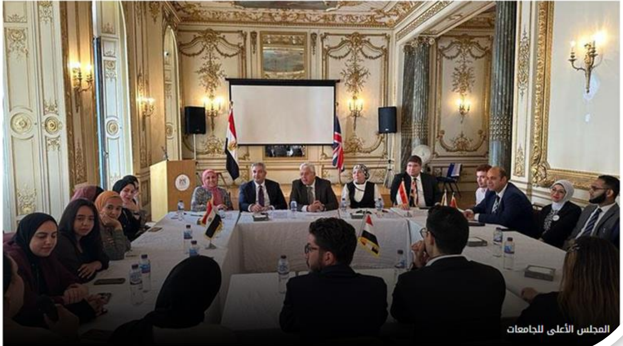
المجلس الأعلى للجامعات