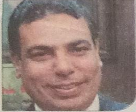
د. عادل عبدالغفار

رقم الجلوس، واسم الطالب؛ حتى لا تحدث أخطاء بالنتائج. وأكد المشرف العام على مكتب تنسيق القبول بالجامعات أنه سوف يتم تزويد برنامج التنسيق الإلكتروني بأسماء وبيانات الطلاب الذين اجتازوا هذه الاختبارات؛ ليتم الترشيح بناء عليها، وتكون الكليات مسئولة مسئولية كاملة عن هذه النتائج في خلال الفترة الزمنية المخصصة لذلك، حيث لن يمتد بأي نتائج أخرى بعد إغلاق موقع التنسيق الإلكتروني لتسجيل الطلاب اللائقين في هذه الاختبارات.