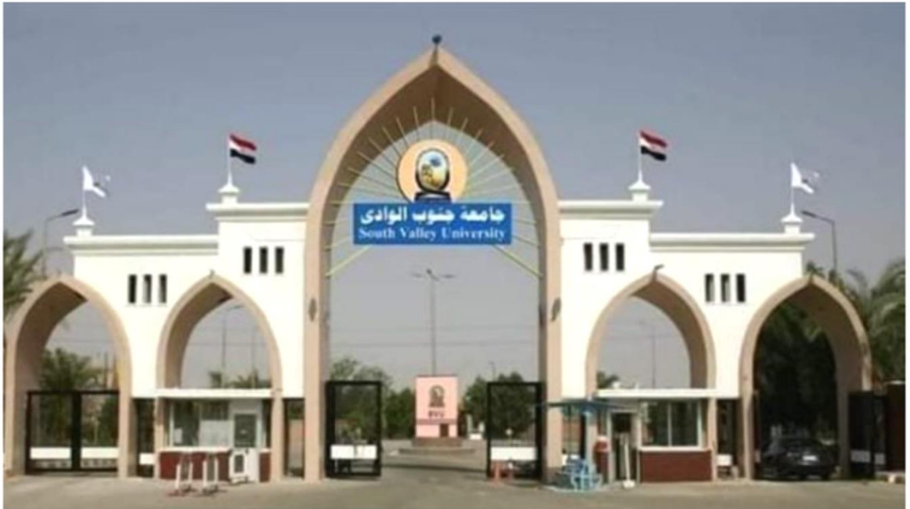
امتحانات القدرات بجامعة جنوب الوادي