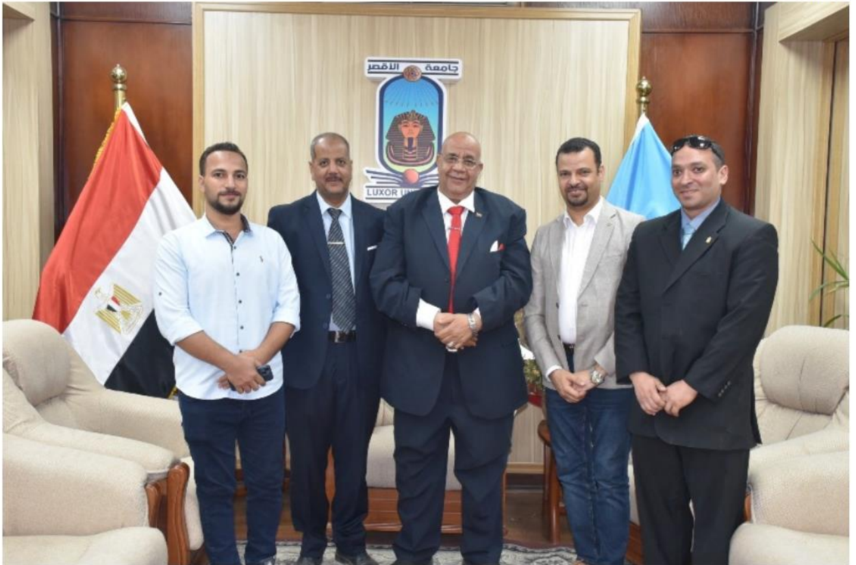
لجنة من المجلس الأعلى للجامعات تتابع سير اختبارات القدرات بكلية الفنون الجميلة