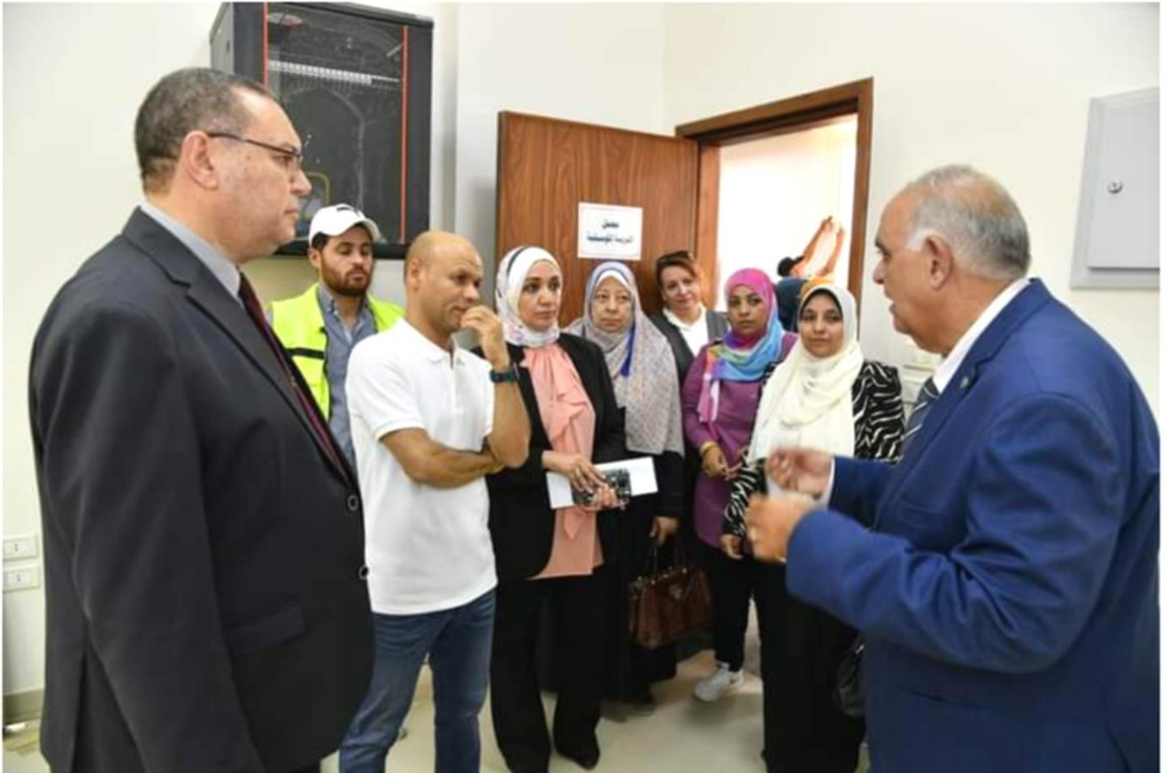
جامعة الوادي الجديد تستقبل لجنة قطاع الطفولة