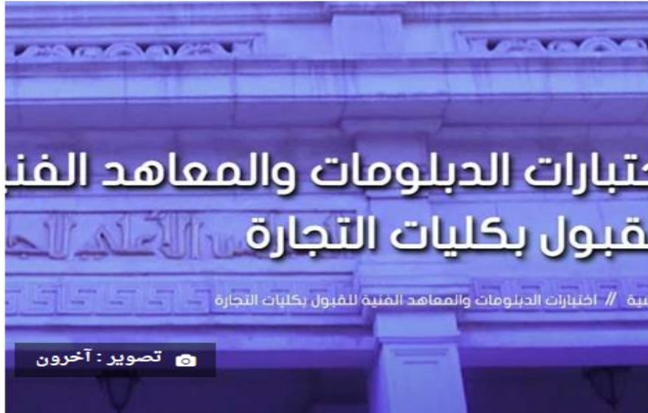
معادلة كلية تجارة