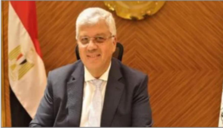
الدكتور أيمن عاشور وزير التعليم العالى

https://www.youm7.com/story/2024/6/10/%D8%A3%D9%8A%D9%85%D9%86-%D8%B9%D8%A7%D8%B4%D9%88%D8%B1-%D9%8A%D8%B3%D8%A7%D9%81%D8%B1-%D8%B1%D9%88%D8%B3%D9%8A%D8%A7-%D9%84%D9%84%D9%85%D8%B4%D8%A7%D8%B1%D9%83%D8%A9-%D9%81%D9%89-%D8%A7%D8%AC%D8%AA%D9%85%D8%A7%D8%B9-%D9%88%D8%B2%D8%B1%D8%A7%D8%A1-%D8%A7%D9%84%D8%AA%D8%B9%D9%84%D9%8A%D9%85-%D8%A7%D9%84%D8%B9%D8%A7%D9%84%D9%8A/6605114