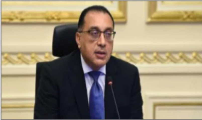
الدكتور مصطفى مدبولى رئيس مجلس الوزراء

https://www.youm7.com/story/2024/6/3/%D9%86%D9%8A%D8%A7%D8%A8%D8%A9-%D8%B9%D9%86-%D8%A7%D9%84%D8%B1%D8%A6%D9%8A%D8%B3-%D8%A7%D9%84%D8%B3%D9%8A%D8%B3%D9%89-%D8%B1%D8%A6%D9%8A%D8%B3-%D8%A7%D9%84%D9%88%D8%B2%D8%B1%D8%A7%D8%A1-%D9%8A%D8%B4%D8%A7%D8%B1%D9%83-%D9%81%D9%89-%D8%A7%D9%81%D8%AA%D8%AA%D8%A7%D8%AD-%D8%A7%D9%84%D9%85%D8%A4%D8%AA%D9%85%D8%B1/6597396