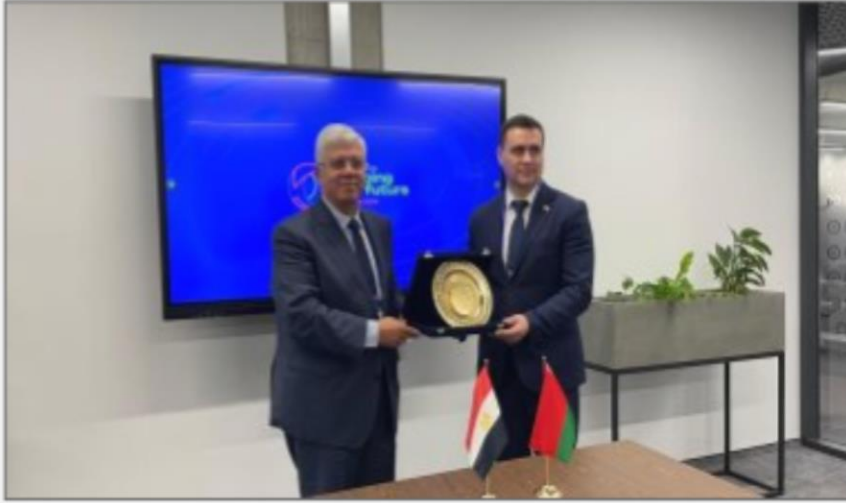
وزير التعليم العالي والبحث العلمى يلتقى بنظيرة البيلا روسى

https://www.youm7.com/story/2024/6/14/%D8%A3%D9%8A%D9%85%D9%86-%D8%B9%D8%A7%D8%B4%D9%88%D8%B1-%D9%8A%D9%84%D8%AA%D9%82%D9%8A-%D9%86%D8%B8%D9%8A%D8%B1%D9%87-%D8%A7%D9%84%D8%A8%D9%8A%D9%84%D8%A7%D8%B1%D9%88%D8%B3%D9%8A-%D9%84%D8%A8%D8%AD%D8%AB-%D8%B3%D9%8F%D8%A8%D9%84-%D8%A7%D9%84%D8%AA%D8%B9%D8%A7%D9%88%D9%86-%D9%81%D9%8A-%D9%85%D8%AC%D8%A7%D9%84/6609486