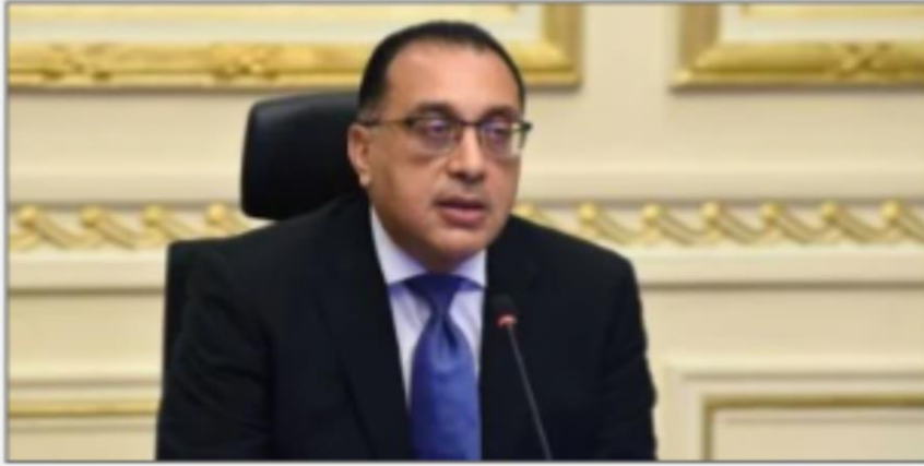
الدكتور مصطفى مدبولي رئيس مجلس الوزراء

https://www.youm7.com/story/2024/6/2/%D8%B1%D8%A6%D9%8A%D8%B3-%D8%A7%D9%84%D9%88%D8%B2%D8%B1%D8%A7%D8%A1-%D9%8A%D9%88%D8%AC%D9%87-%D8%A8%D8%B7%D8%B1%D8%AD-%D8%B1%D8%A4%D9%8A%D8%A9-%D8%AA%D8%B7%D9%88%D9%8A%D8%B1-%D9%85%D8%B1%D8%AD%D9%84%D8%A9-%D8%A7%D9%84%D8%AB%D8%A7%D9%86%D9%88%D9%8A%D8%A9-%D8%A7%D9%84%D8%B9%D8%A7%D9%85%D8%A9-%D9%84%D9%84%D8%AD%D9%88%D8%A7%D8%B1/6596290