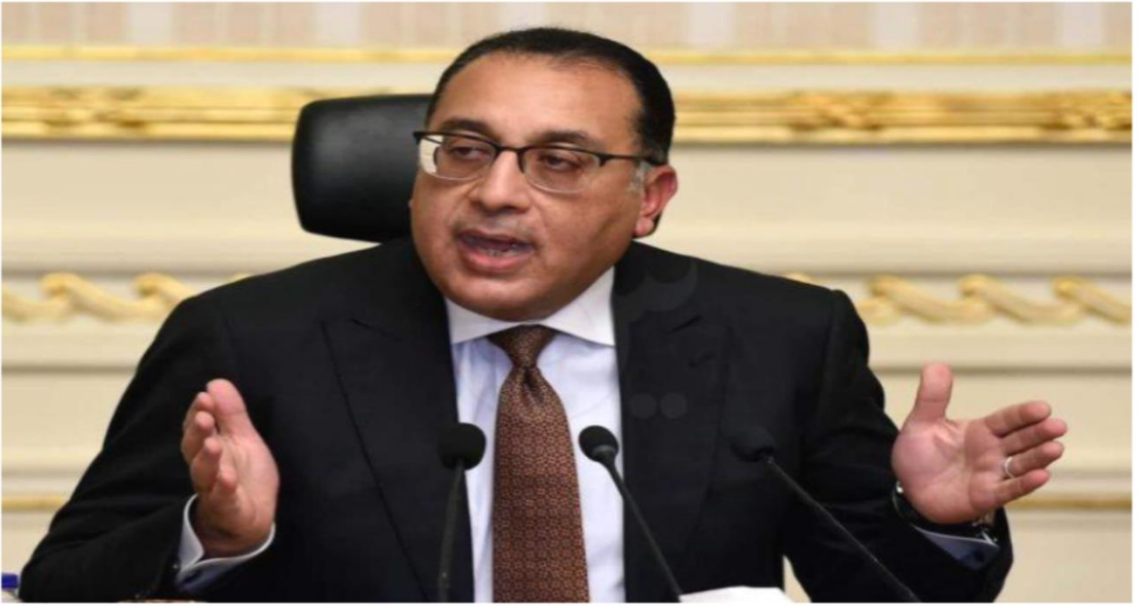
الدكتور مصطفى مدبولي رئيس مجلس الوزراء

آخر تحديث : الأحد, 2 يونيو, 2024 - 1:20 مساءً