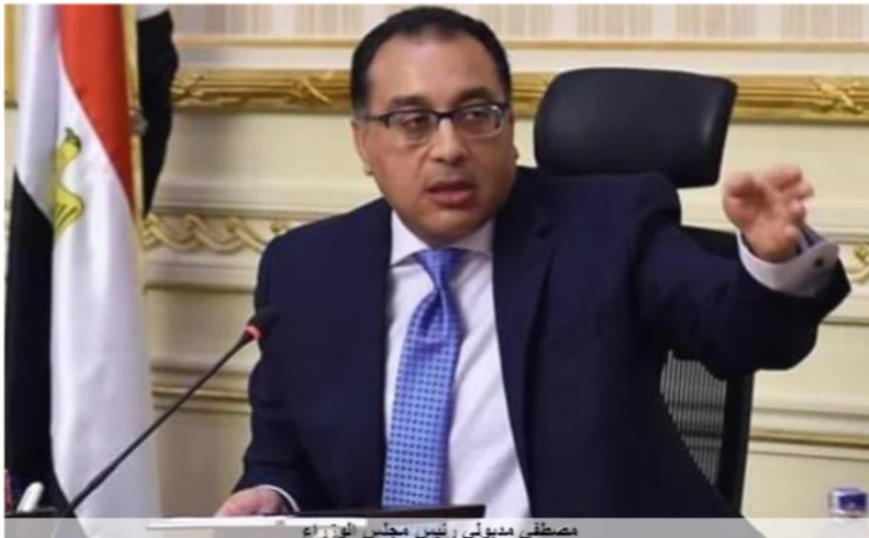
مصطفى مديولى رئيس مجلس الوزراء