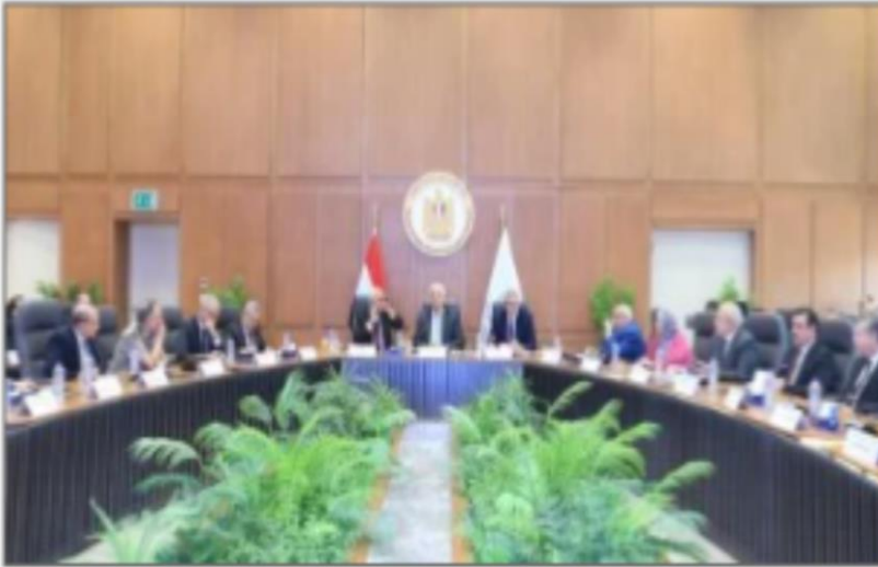
المجلس الأعلى للجامعات

https://www.youm7.com/story/2024/6/27/%D8%AA%D9%86%D8%B3%D9%8A%D9%82-%D8%A7%D9%84%D9%82%D8%A8%D9%88%D9%84-%D8%A8%D8%A7%D9%84%D8%AC%D8%A7%D9%85%D8%B9%D8%A7%D8%AA-%D9%84%D9%83%D8%A7%D9%81%D8%A9-%D8%A7%D9%84%D8%B4%D9%87%D8%A7%D8%AF%D8%A7%D8%AA-%D8%A8%D9%86%D9%81%D8%B3-%D9%82%D9%88%D8%A7%D8%B9%D8%AF-%D8%A7%D9%84%D8%B9%D8%A7%D9%85-%D8%A7%D9%84%D9%85%D8%A7%D8%B6%D9%89-%D8%AA%D9%81%D8%A7%D8%B5%D9%8A%D9%84/6620838