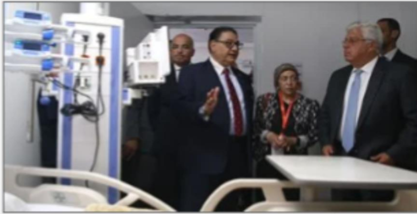
الدكتور أيمن عاشور وزير التعليم العالي والبحث العلمى

https://www.youm7.com/story/2024/6/25/%D9%88%D8%B2%D9%8A%D8%B1-%D8%A7%D9%84%D8%AA%D8%B9%D9%84%D9%8A%D9%85-%D8%A7%D9%84%D8%B9%D8%A7%D9%84%D9%89-%D9%8A%D9%84%D8%AA%D9%82%D9%89-%D8%B1%D8%A4%D8%B3%D8%A7%D8%A1-%D9%85%D8%B1%D8%A7%D9%83%D8%B2-%D8%A7%D9%84%D8%AA%D9%85%D9%8A%D8%B2-%D9%88%D9%85%D9%85%D8%AB%D9%84%D9%89-%D8%A7%D9%84%D9%88%D9%83%D8%A7%D9%84%D8%A9-%D8%A7%D9%84%D8%A3%D9%85%D8%B1%D9%8A%D9%83%D9%8A%D8%A9/6618520