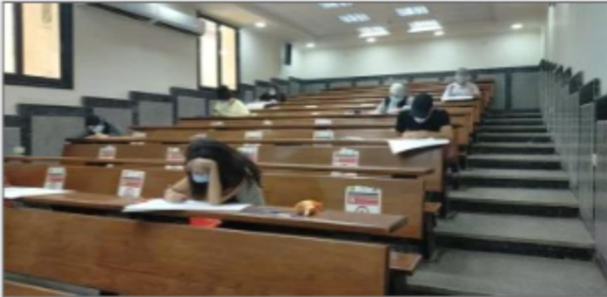
اختبارات القدرات - أرشيكية

https://www.youm7.com/story/2024/7/18/%D8%A7%D8%AE%D8%AA%D8%A8%D8%A7%D8%B1%D8%A7%D8%AA-%D8%A7%D9%84%D9%82%D8%AF%D8%B1%D8%A7%D8%AA-2024-%D9%83%D9%84%D9%8A%D8%A7%D8%AA-%D9%8A%D8%B4%D8%AA%D8%B1%D8%B7-%D8%A7%D9%84%D9%82%D8%A8%D9%88%D9%84-%D8%A8%D9%87%D8%A7-%D8%A7%D8%AC%D8%AA%D9%8A%D8%A7%D8%B2-%D8%A7%D8%AE%D8%AA%D8%A8%D8%A7%D8%B1%D8%A7%D8%AA-%D8%A7%D9%84%D9%82%D8%AF%D8%B1%D8%A7%D8%AA/6642636