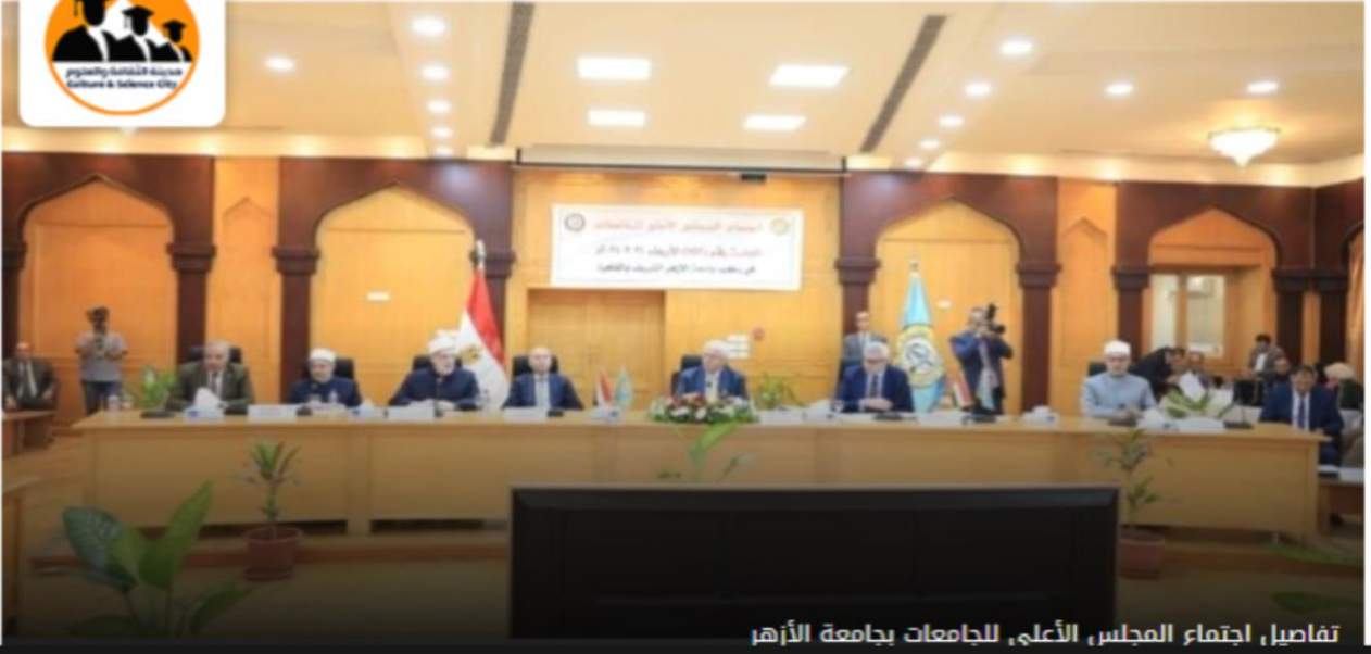
تفاصيل اجتماع المجلس الأعلى للجامعات بجامعة الأزهر

https://www.masrawy.com/news/education-universityeducation/details/2024/7/31/2620059/%D8%AA%D9%81%D8%A7%D8%B5%D9%8A%D9%84-%D8%A7%D8%AC%D8%AA%D9%85%D8%A7%D8%B9-%D8%A7%D9%84%D9%85%D8%AC%D9%84%D8%B3-%D8%A7%D9%84%D8%A3%D8%B9%D9%84%D9%89-%D9%84%D9%84%D8%AC%D8%A7%D9%85%D8%B9%D8%A7%D8%AA-%D8%A8%D8%AC%D8%A7%D9%85%D8%B9%D8%A9-%D8%A7%D9%84%D8%A3%D8%B2%D9%87%D8%B1-2024