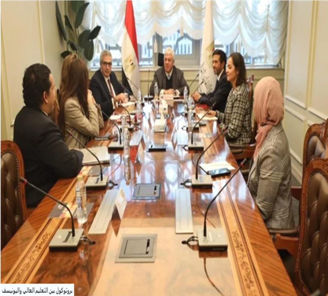
بروتوكول بين التعليم العالي واليونسف

https://www.dostor.org/4948156#goog_rewarded