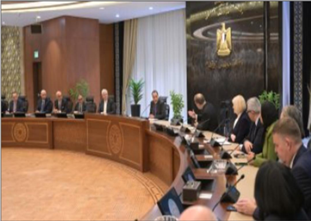
الدكتور مصطفى مدبولي رئيس مجلس الوزراء

https://www.youm7.com/story/2025/1/19/%D8%B1%D8%A6%D9%8A%D8%B3-%D8%A7%D9%84%D9%88%D8%B2%D8%B1%D8%A7%D8%A1-%D9%8A%D9%84%D8%AA%D9%82%D9%8A-%D9%88%D9%81%D8%AF-%D8%AC%D8%A7%D9%85%D8%B9%D8%A9-%D8%A5%D9%83%D8%B3%D8%AA%D8%B1-%D8%A7%D9%84%D8%A8%D8%B1%D9%8A%D8%B7%D8%A7%D9%86%D9%8A%D8%A9/685174