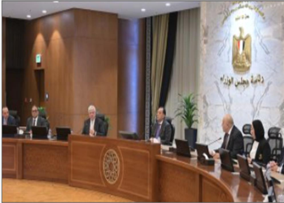
الدكتور مصطفى مدبولي رئيس مجلس الوزراء

https://www.youm7.com/story/2025/1/19/%D9%85%D8%AF%D8%A8%D9%88%D9%84%D9%89-%D9%8A%D9%84%D8%AA%D9%82%D9%89-%D8%B9%D8%AF%D8%AF%D9%8B%D8%A7-%D9%85%D9%86-%D9%85%D9%85%D8%AB%D9%84%D9%89-%D8%AF%D9%88%D8%B1-%D8%A7%D9%84%D9%86%D8%B4%D8%B1-%D8%A7%D9%84%D8%AF%D9%88%D9%84%D9%8A%D8%A9-%D9%84%D9%84%D8%AA%D8%B9%D8%A7%D9%88%D9%86-%D9%85%D8%B9/6851867