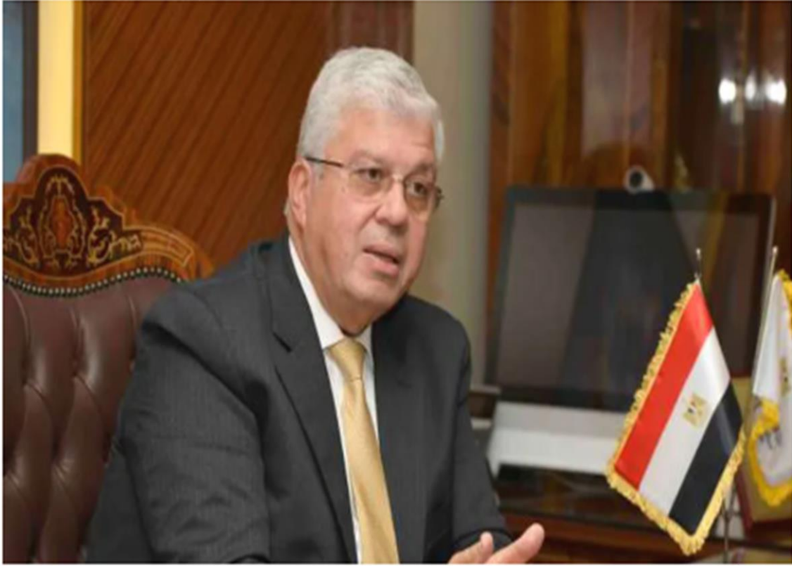
الدكتور محمد أيمن عاشور وزير التعليم العالي

https://www.elwatannews.com/news/details/7764080#goog_rewarded