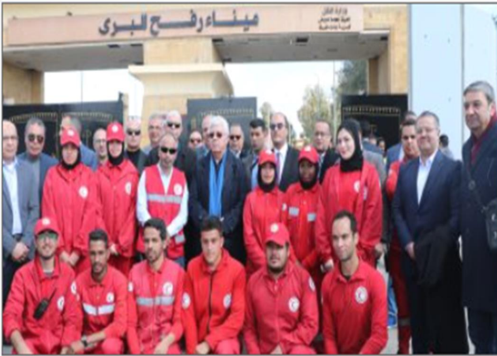
وزير التعليم العالي أمام معبر رفح

https://www.youm7.com/story/2025/1/20/%D9%88%D8%B2%D9%8A%D8%B1-%D8%A7%D9%84%D8%AA%D8%B9%D9%84%D9%8A%D9%85-%D8%A7%D9%84%D8%B9%D8%A7%D9%84%D9%8A-%D9%85%D9%86-%D9%85%D8%B9%D8%A8%D8%B1-%D8%B1%D9%81%D8%AD-%D8%A7%D9%84%D9%85%D8%B3%D8%AA%D8%B4%D9%81%D9%8A%D8%A7%D8%AA-%D8%A7%D9%84%D8%AC%D8%A7%D9%85%D8%B9%D9%8A%D8%A9-%D9%85%D8%B3%D8%AA%D8%B9%D8%AF%D8%A9-%D9%84%D8%A7%D8%B3%D8%AA%D9%82%D8%A8%D8%A7%D9%84/6853099