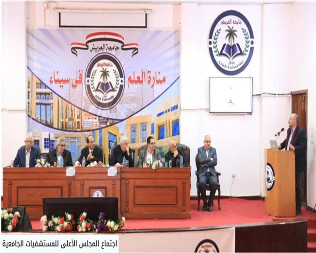
اجتماع المجلس الأعلى للمستشفيات الجامعية