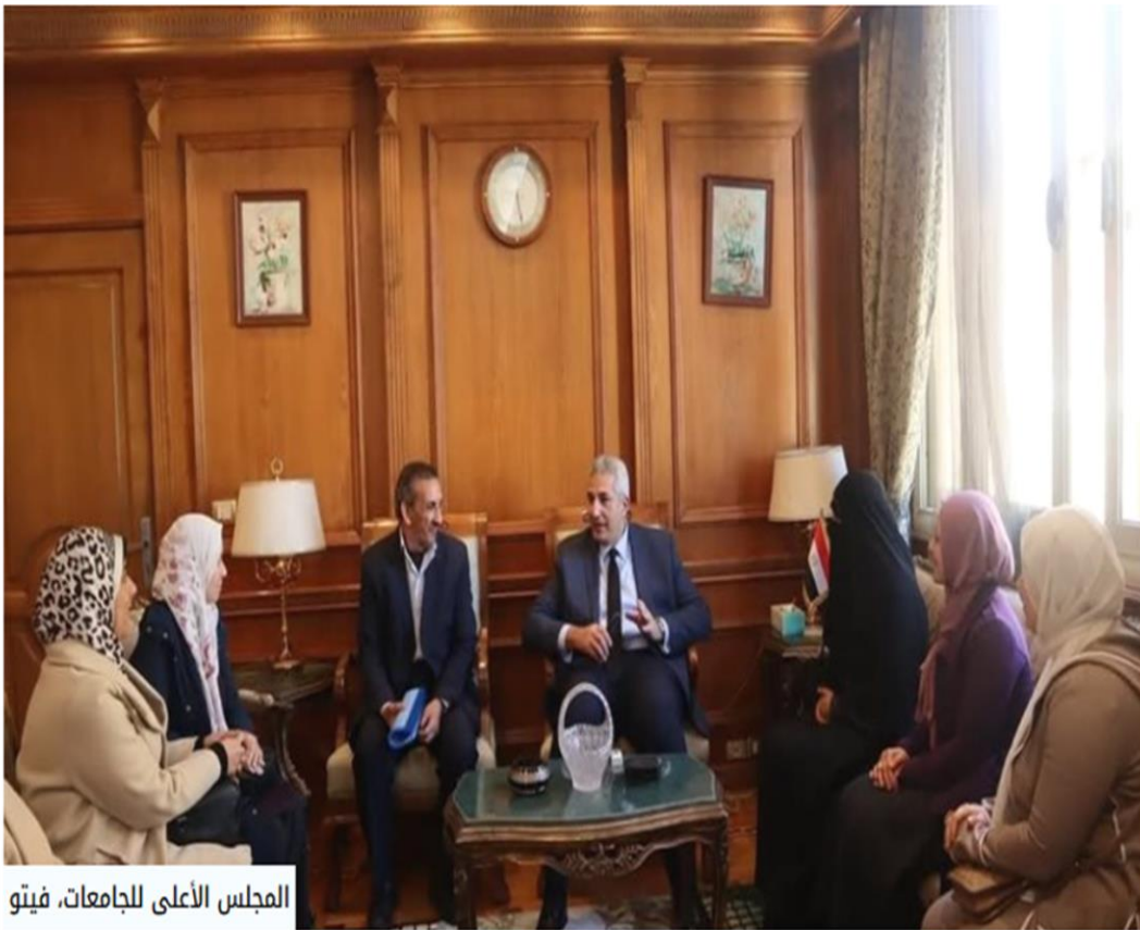
المجلس الأعلى للجامعات، فيتو

https://scu.eg/news/%d8%a3%d9%85%d9%8a%d9%86-%d8%b9%d8%a7%d9%85-%d8%a7%d9%84%d9%85%d8%ac%d9%84%d8%b3-%d8%a7%d9%84%d8%a3%d8%b9%d9%84%d9%89-%d9%84%d9%84%d8%ac%d8%a7%d9%85%d8%b9%d8%a7%d8%aa-%d9%8a%d9%84%d8%aa%d9%82%d9%89/