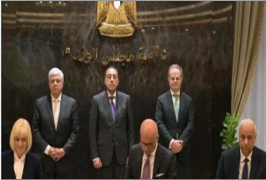
رئيس الوزراء يشهد توقيع مذكرة التفاهم

https://www.youm7.com/story/2025/1/19/%D9%85%D8%AF%D8%A8%D9%88%D9%84%D9%89-%D9%8A%D8%B4%D9%87%D8%AF-%D8%AA%D9%88%D9%82%D9%8A%D8%B9-%D9%85%D8%B0%D9%83%D8%B1%D8%A9-%D8%AA%D9%81%D8%A7%D9%87%D9%85-%D9%84%D8%AA%D8%A3%D8%B3%D9%8A%D8%B3-%D8%AD%D8%B1%D9%85-%D8%B1%D8%A7%D8%A6%D8%AF-%D9%84%D8%AC%D8%A7%D9%85%D8%B9%D8%A9-%D8%A5%D9%83%D8%B3%D8%AA%D8%B1/6851653