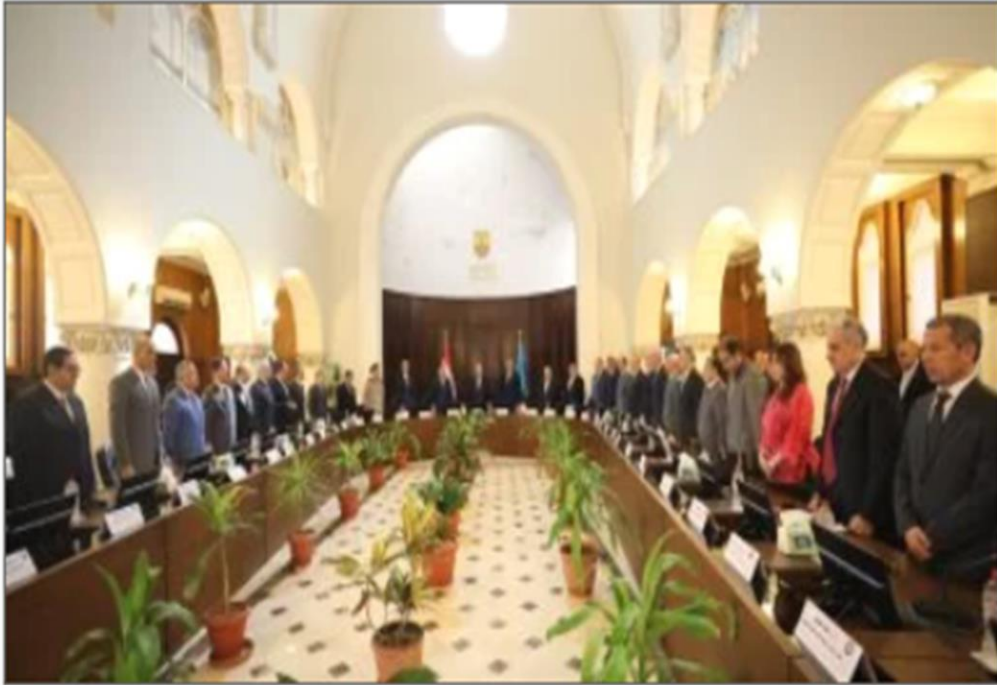
المجلس الأعلى للجامعات

https://www.youm7.com/story/2025/1/1/%D8%A7%D9%84%D9%85%D8%AC%D9%84%D8%B3-%D8%A7%D9%84%D8%A3%D8%B9%D9%84%D9%89-%D9%84%D9%84%D8%AC%D8%A7%D9%85%D8%B9%D8%A7%D8%AA-%D9%8A%D8%B9%D8%AA%D9%85%D8%AF-%D8%A7%D8%AE%D8%AA%D8%B5%D8%A7%D8%B5%D8%A7%D8%AA-%D9%88%D8%AA%D8%B4%D9%83%D9%8A%D9%84-%D9%84%D8%AC%D8%A7%D9%86-%D8%A7%D9%84%D9%82%D8%B7%D8%A7%D8%B9/6831630