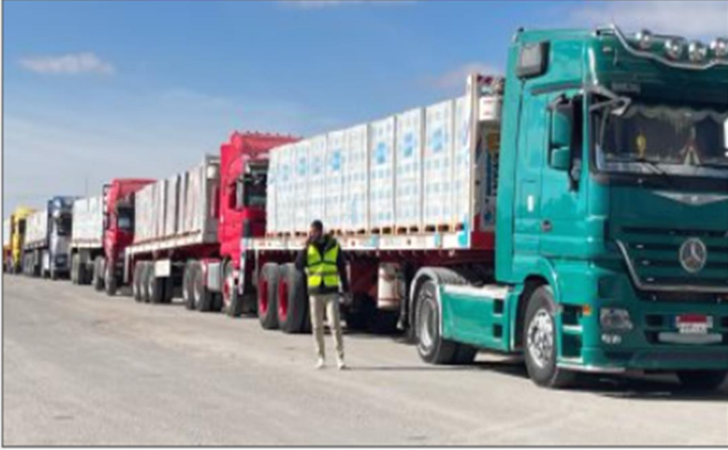
تدفق المساعدات عبر معبر رفح

https://www.youm7.com/story/2025/1/20/%D9%85%D8%B5%D8%B1-%D8%AA%D9%85%D8%AF-%D9%8A%D8%AF-%D8%A7%D9%84%D8%B9%D9%88%D9%86-%D9%84%D9%84%D8%A3%D8%B4%D9%82%D8%A7%D8%A1-%D9%81%D9%8A-%D8%BA%D8%B2%D8%A9-%D8%AC%D9%87%D9%88%D8%AF-%D8%A5%D8%BA%D8%A7%D8%AB%D9%8A%D8%A9-%D9%85%D9%83%D8%AB%D9%81%D8%A9/6853013