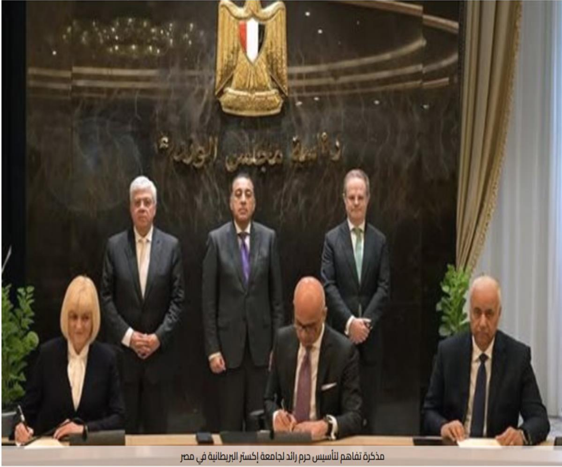
مذكرة تفاهم لتأسيس حرم رائد لجامعة إكستر البريطانية في مصر