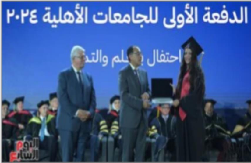
رئيس الوزراء - أرشيفية

https://www.youm7.com/story/2024/9/12/%D8%B1%D8%A6%D9%8A%D8%B3-%D8%A7%D9%84%D9%88%D8%B2%D8%B1%D8%A7%D8%A1-%D9%8A%D8%B4%D9%87%D8%AF-%D8%AD%D9%81%D9%84-%D8%AA%D8%AE%D8%B1%D9%8A%D8%AC-%D8%A7%D9%84%D8%AF%D9%81%D8%B9%D8%A9-%D8%A7%D9%84%D8%A3%D9%88%D9%84%D9%89-%D9%85%D9%86-%D8%B7%D9%84%D8%A7%D8%A8-%D8%A7%D9%84%D8%AC%D8%A7%D9%85%D8%B9%D8%A7%D8%AA/6705671