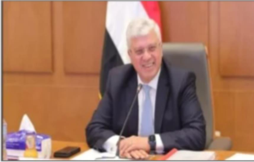
الدكتور أيمن عاشور وزير التعليم العالى

https://www.youm7.com/story/2024/9/30/%D8%A7%D9%84%D8%AA%D8%B9%D9%84%D9%8A%D9%85-%D8%A7%D9%84%D8%B9%D8%A7%D9%84%D9%89-%D9%85%D8%B4%D8%A7%D8%B1%D9%83%D8%A9-%D8%A7%D9%84%D8%AC%D8%A7%D9%85%D8%B9%D8%A7%D8%AA-%D9%81%D9%89-%D9%85%D8%A8%D8%A7%D8%AF%D8%B1%D8%AA%D9%89-%D8%A8%D8%AF%D8%A7%D9%8A%D8%A9-%D8%AC%D8%AF%D9%8A%D8%AF%D8%A9-%D9%88100-%D9%8A%D9%88%D9%85/6719510