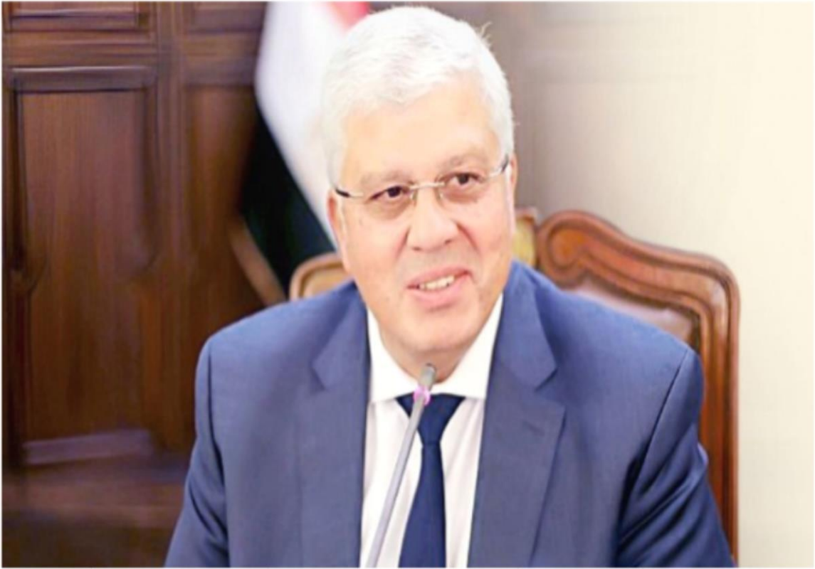
الدكتور أيمن عاشور وزير التعليم العالي والبحث العلمي

https://www.elwatannews.com/news/details/7558335