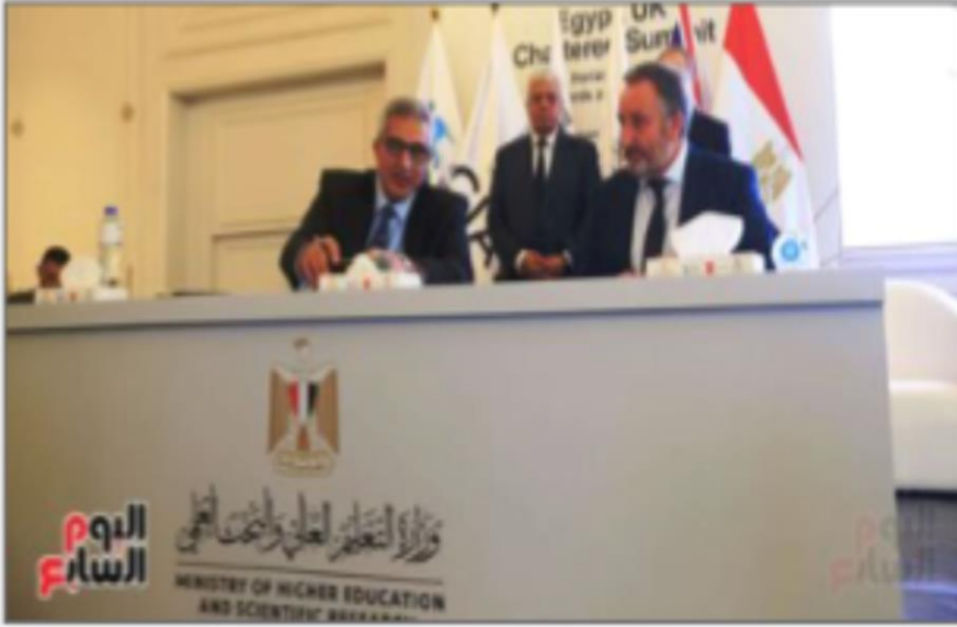
جانب من المؤتمر

https://www.youm7.com/story/2024/9/26/%D8%A7%D9%84%D9%83%D9%84%D9%8A%D8%A9-%D8%A7%D9%84%D9%85%D9%84%D9%83%D9%8A%D8%A9-%D9%84%D9%84%D8%AC%D8%B1%D8%A7%D8%AD%D9%8A%D9%86-%D8%A7%D9%84%D8%A8%D8%B1%D9%8A%D8%B7%D8%A7%D9%86%D9%8A%D8%A9-%D9%81%D9%89-%D8%A5%D8%AF%D9%86%D8%A8%D8%B1%D8%A9-%D8%AA%D9%81%D8%AA%D8%AD-%D9%85%D9%83%D8%AA%D8%A8%D8%A7%D9%8B-%D9%84%D9%87%D8%A7-%D8%A8%D9%85%D8%B5%D8%B1/6720449