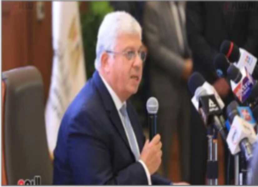
الدكتور أيمن عاشور

https://www.youm7.com/story/2024/9/22/GENZ-%D8%A3%D8%B6%D8%AE%D9%85-%D8%A8%D8%B1%D9%86%D8%A7%D9%85%D8%AC-%D8%A8%D9%8A%D9%86-%D8%B7%D9%84%D8%A7%D8%A8-%D8%AC%D8%A7%D9%85%D8%B9%D8%A7%D8%AA-%D9%85%D8%B5%D8%B1-%D9%81%D9%8A-%D8%A7%D9%84%D8%A8%D8%AD%D8%AB-%D8%A7%D9%84%D8%B9%D9%84%D9%85%D9%8A/6716100