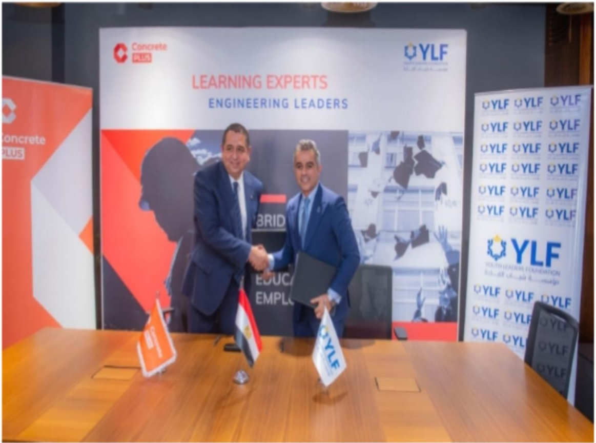
مؤسسة شباب القادة

https://www.elwatannews.com/news/details/7587240