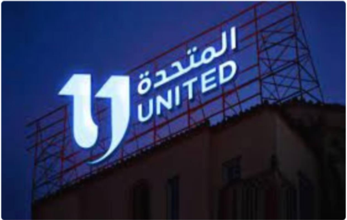
الشركة المتحدة للخدمات الإعلامية

التمويل يصل لـ100 مليون جنيه.. تفاصيل تعاون "المتحدة والتعليم العالي" لاكتشاف المبتكرين ببرنامج GEN Z فى مجالات الابتكار وريادة الأعمال.. انطلاق المسابقات بإقليم الجمهورية.. وتمويل للشركات الفائزة.. فيديو