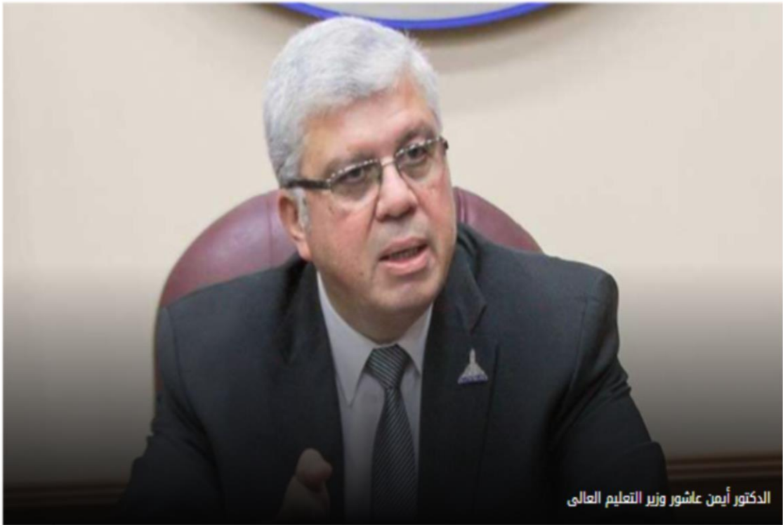
الدكتور أيمن عاشور وزير التعليم العالي

https://www.masrawy.com/news/education-universityeducation/details/2024/9/30/2651206/%D8%A7%D9%84%D8%A3%D8%B9%D9%84%D9%89-%D9%84%D9%84%D8%AC%D8%A7%D9%85%D8%B9%D8%A7%D8%AA-%D9%8A%D8%B3%D8%AA%D8%B9%D8%B1%D8%B6-%D8%AA%D9%81%D8%A7%D8%B5%D9%8A%D9%84-%D9%85%D8%B4%D8%B1%D9%88%D8%B9-%D8%AA%D8%B7%D9%88%D9%8A%D8%B1-%D9%85%D8%B3%D8%AA%D8%B4%D9%81%D9%8A%D8%A7%D8%AA-%D9%82%D8%B5%D8%B1-%D8%A7%D9%84%D8%B9%D9%8A%D9%86%D9%8A-