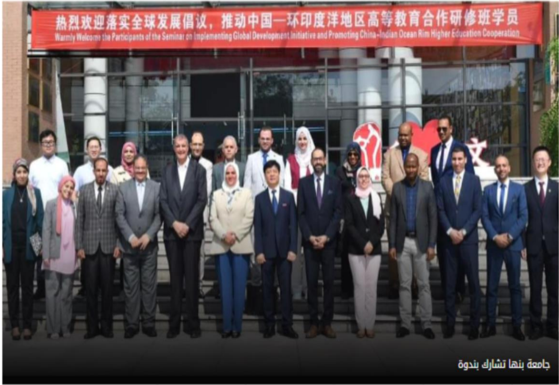
جامعة بنها تشارك بندوة

https://www.masrawy.com/news/news_regions/details/2024/9/2/2636568/%D8%AC%D8%A7%D9%85%D8%B9%D8%A9-%D8%A8%D9%86%D9%87%D8%A7-%D8%AA%D8%B4%D8%A7%D8%B1%D9%83-%D8%A8%D9%86%D8%AF%D9%88%D8%A9-%D8%AD%D9%88%D9%84-%D8%AA%D8%B9%D8%B2%D9%8A%D8%B2-%D8%A7%D9%84%D8%AA%D8%B9%D8%A7%D9%88%D9%86-%D8%A7%D9%84%D8%AA%D8%B9%D9%84%D9%8A%D9%85%D9%8A-%D8%A8%D9%8A%D9%86-%D8%A7%D9%84%D8%B5%D9%8A%D9%86-%D9%88%D8%AF%D9%88%D9%84-%D8%A7%D9%84%D9%85%D8%AD%D9%8A%D8%B7-%D8%A7%D9%84%D9%87%D9%86%D8%AF%D9%8A