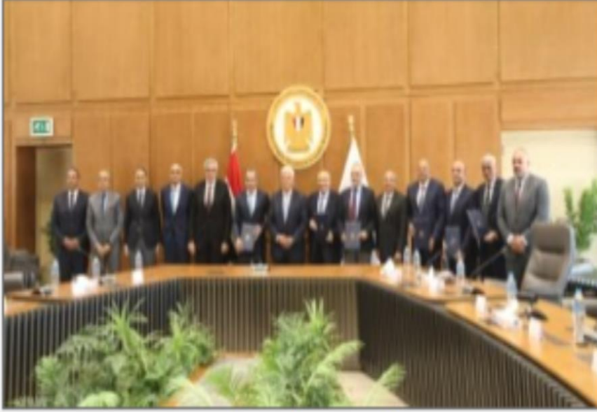
مراسم توقيع مذكرة التفاهم

https://www.youm7.com/story/2024/9/29/%D9%88%D8%B2%D9%8A%D8%B1-%D8%A7%D9%84%D8%AA%D8%B9%D9%84%D9%8A%D9%85-%D8%A7%D9%84%D8%B9%D8%A7%D9%84%D9%8A-%D9%8A%D8%B4%D9%87%D8%AF-%D8%AA%D9%88%D9%82%D9%8A%D8%B9-%D9%85%D8%B0%D9%83%D8%B1%D8%A9-%D9%85%D8%B9-%D8%B4%D8%B1%D9%83%D8%A9-%D8%A7%D9%84%D8%B9%D8%A7%D8%B5%D9%85%D8%A9-%D8%A7%D9%84%D8%A5%D8%AF%D8%A7%D8%B1%D9%8A%D8%A9/6724202