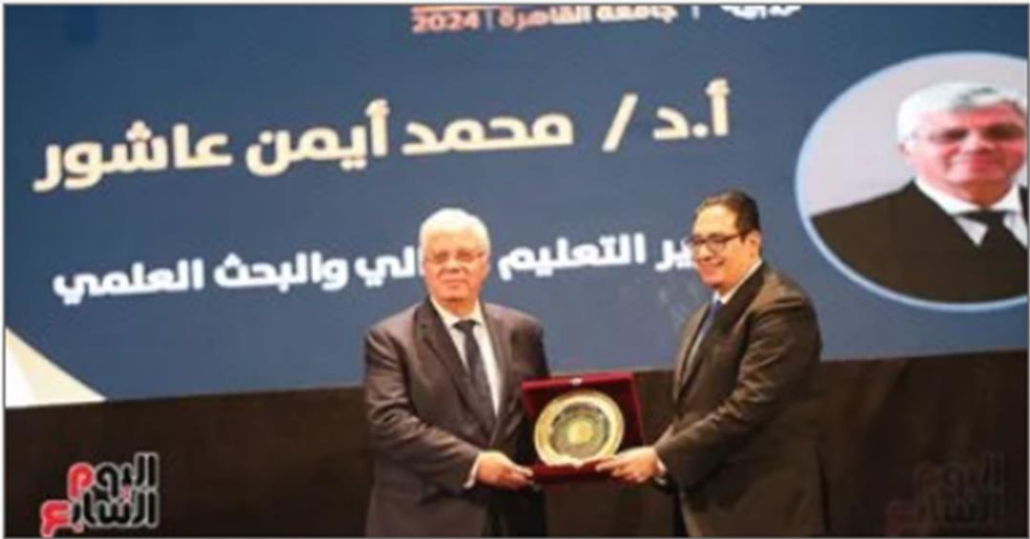
الدكتور أيمن عاشور وزير التعليم العالى

https://www.youm7.com/story/2024/12/22/%D8%AC%D8%A7%D9%85%D8%B9%D8%A9-%D8%A7%D9%84%D9%82%D8%A7%D9%87%D8%B1%D8%A9-%D8%AA%D8%B4%D9%87%D8%AF-%D8%A7%D8%AD%D8%AA%D9%81%D8%A7%D9%84%D9%8A%D8%A9-%D8%B9%D9%8A%D8%AF-%D8%A7%D9%84%D8%B9%D9%84%D9%85-%D8%A7%D9%84%D9%8019-%D9%88%D8%AA%D9%83%D8%B1%D9%85-70-%D8%B9%D8%A7%D9%84%D9%85%D8%A7/6820806