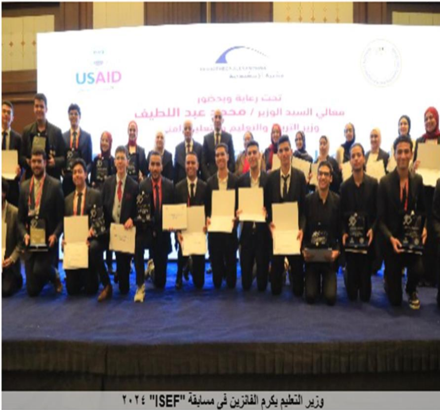
وزير التعليم يكرم الفائزين في مسابقة "ISEF" ٢٠٢٤