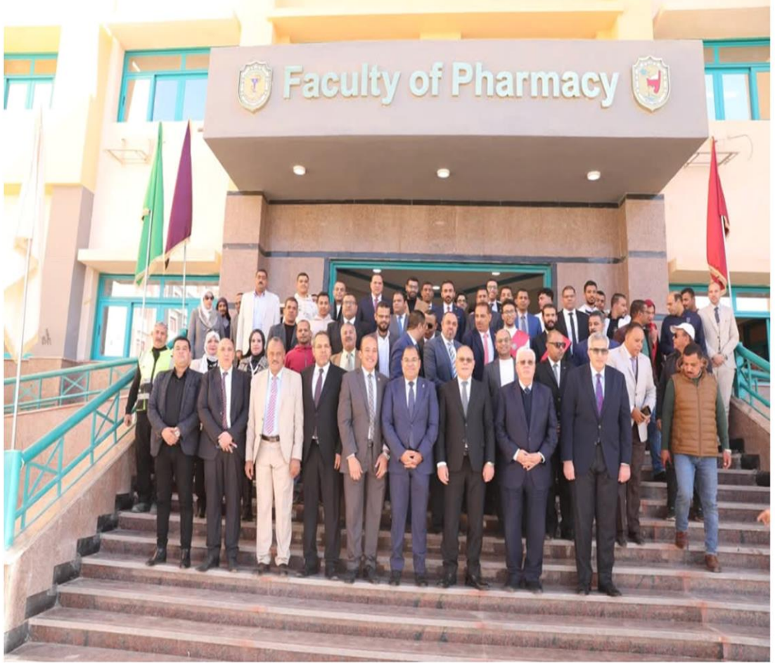
وزير التعليم العالي ورئيس جامعة سوهاج يفتتحان كليتي الأسنان والصيدلة

https://gate.ahram.org.eg/News/5063302.aspx