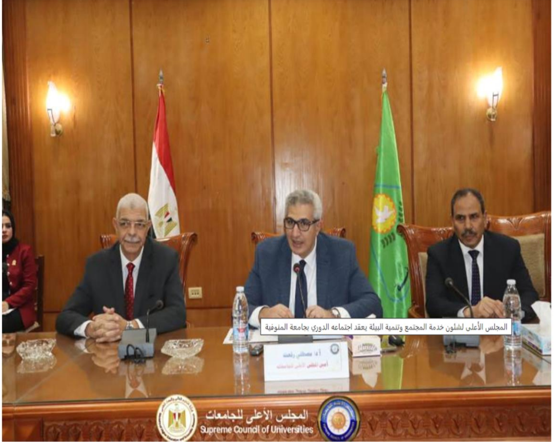
المجلس الأعلى لشئون خدمة المجتمع وتنمية البيئة يعقد اجتماعه الدوري بجامعة المنوفية

https://gate.ahram.org.eg/News/5051026.aspx