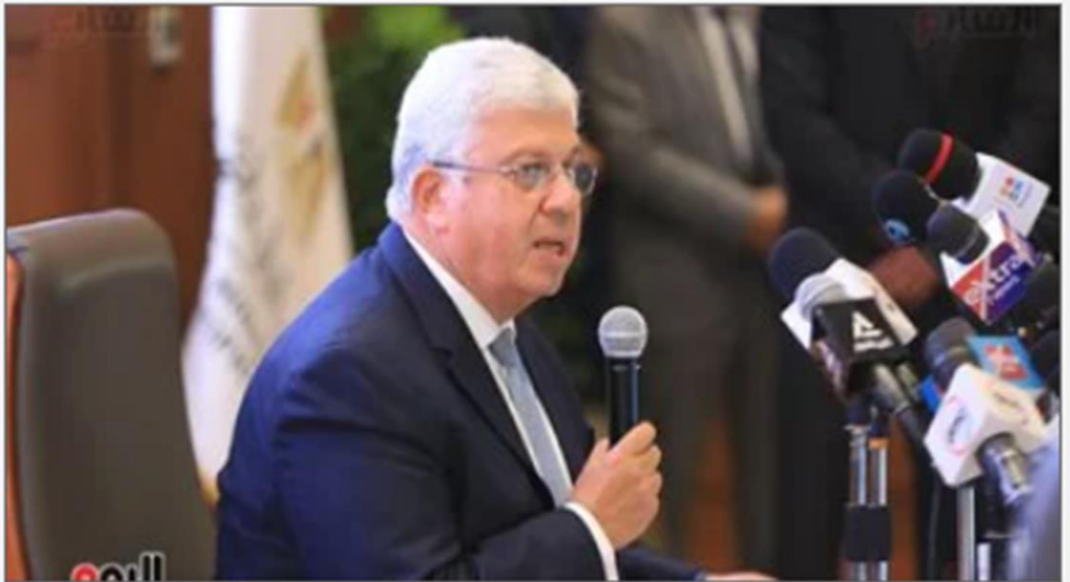
الدكتور أيمن عاشور وزير التعليم العالي

https://www.youm7.com/story/2024/12/17/%D9%88%D8%B2%D9%8A%D8%B1-%D8%A7%D9%84%D8%AA%D8%B9%D9%84%D9%8A%D9%85-%D8%A7%D9%84%D8%B9%D8%A7%D9%84%D9%89-%D9%8A%D8%B9%D9%84%D9%86-%D8%AA%D8%B4%D9%83%D9%8A%D9%84-%D9%85%D8%AC%D9%84%D8%B3-%D8%A3%D9%85%D9%86%D8%A7%D8%A1-%D8%A7%D9%84%D9%85%D8%A8%D8%A7%D8%AF%D8%B1%D8%A9-%D8%A7%D9%84%D8%B1%D8%A6%D8%A7%D8%B3%D9%8A%D8%A9-%D8%AA%D8%AD%D8%A7%D9%84%D9%81/6814478