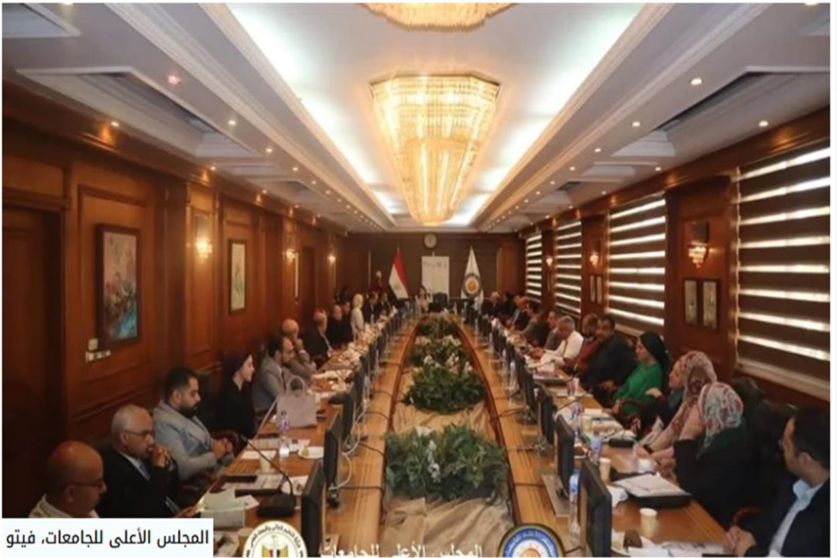
المجلس الأعلى للجامعات