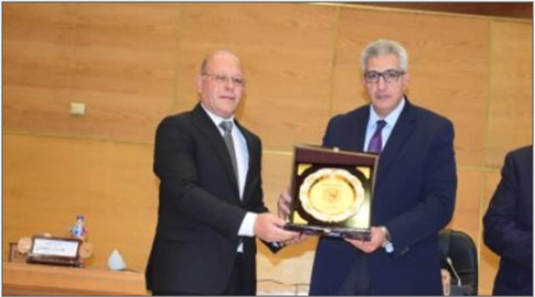
وزير التعليم العالي ورئيس جامعة سوهاج

https://www.youm7.com/story/2024/12/28/%D9%88%D8%B2%D9%8A%D8%B1-%D8%A7%D9%84%D8%AA%D8%B9%D9%84%D9%8A%D9%85-%D8%A7%D9%84%D8%B9%D8%A7%D9%84%D9%89-%D9%8A%D9%81%D8%AA%D8%AA%D8%AD-%D8%B9%D8%AF%D8%AF%D8%A7-%D9%85%D9%86-%D8%A7%D9%84%D9%85%D9%86%D8%B4%D8%A2%D8%AA-%D8%A7%D9%84%D8%AA%D8%B9%D9%84%D9%8A%D9%85%D9%8A%D8%A9-%D8%A8%D8%AC%D8%A7%D9%85%D8%B9%D8%A9-%D8%B3%D9%88%D9%87%D8%A7%D8%AC/6827337