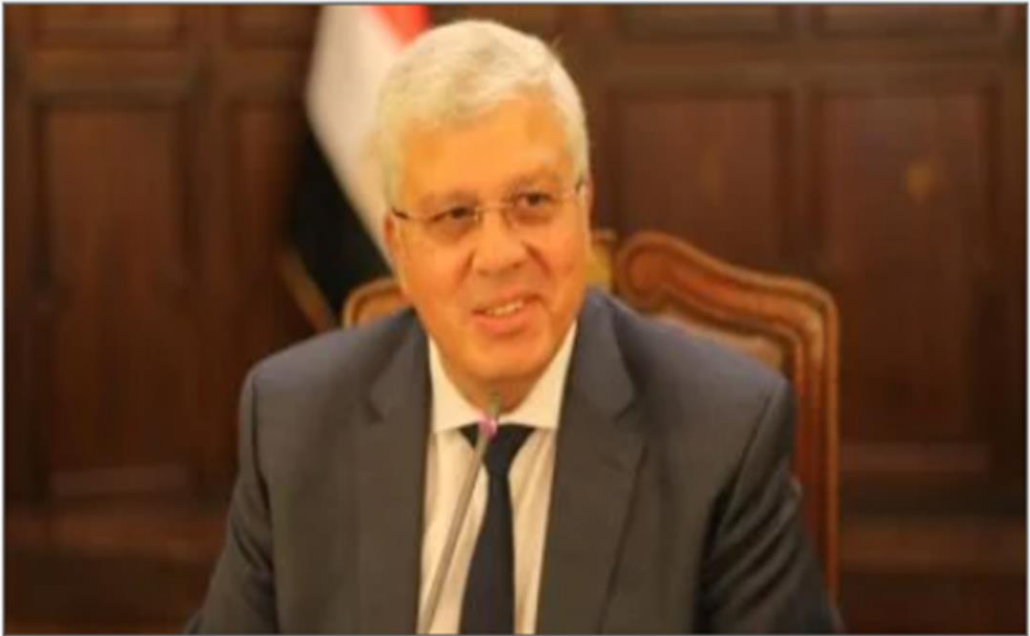
الدكتور أيمن عاشور وزير التعليم العالي

https://www.youm7.com/story/2024/12/16/%D9%88%D8%B2%D9%8A%D8%B1-%D8%A7%D9%84%D8%AA%D8%B9%D9%84%D9%8A%D9%85-%D8%A7%D9%84%D8%B9%D8%A7%D9%84%D9%8A-%D9%8A%D8%B4%D9%87%D8%AF-%D8%AA%D9%88%D9%82%D9%8A%D8%B9-%D9%85%D8%B0%D9%83%D8%B1%D8%A9-%D8%A8%D9%8A%D9%86-%D8%AC%D8%A7%D9%85%D8%B9%D8%A9-%D8%A7%D9%84%D9%82%D8%A7%D9%87%D8%B1%D8%A9-%D9%88%D9%85%D8%AE%D8%AA%D8%A8%D8%B1/6813166