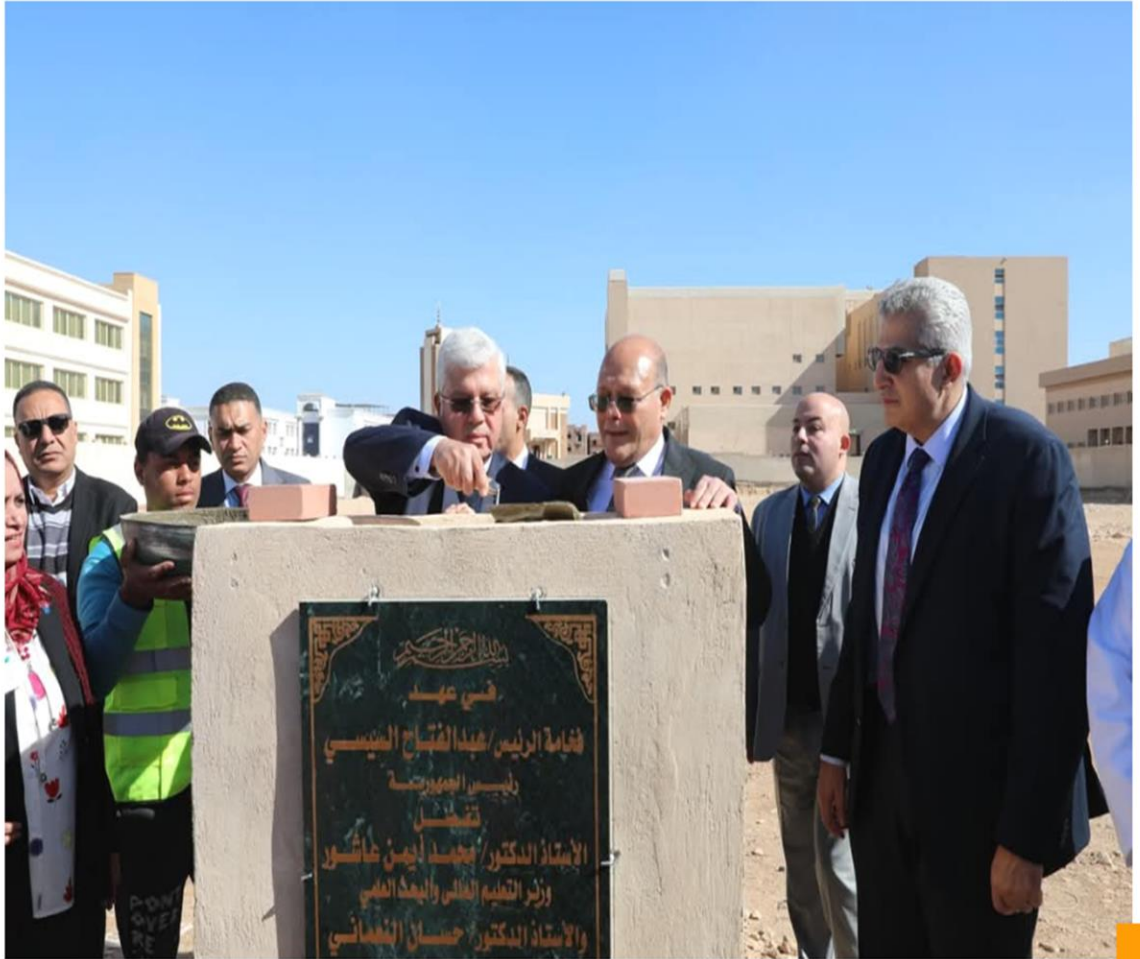
وزير التعليم العالي ، ورئيس جامعة سوهاج يضعان حجر الأساس لمستشفى الحروق.

https://gate.ahram.org.eg/News/5063368.aspx