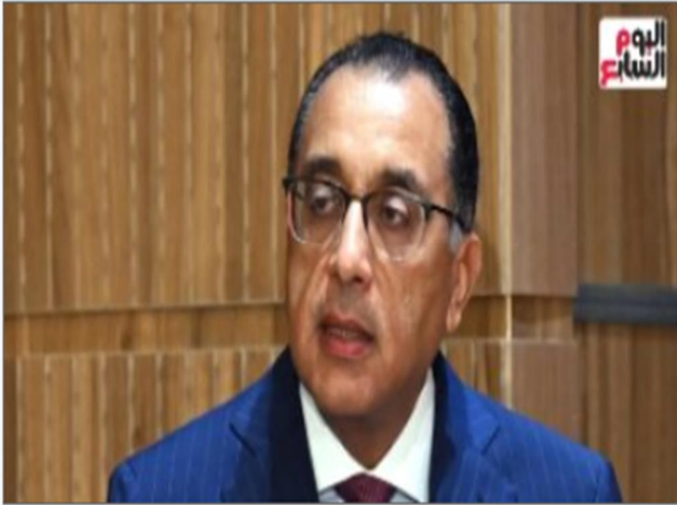
الدكتور مصطفى مدبولي رئيس مجلس الوزراء

https://www.youm7.com/story/2024/12/24/%D8%B1%D8%A6%D9%8A%D8%B3-%D8%A7%D9%84%D9%88%D8%B2%D8%B1%D8%A7%D8%A1-%D9%8A%D8%AA%D8%A7%D8%A8%D8%B9-%D8%A7%D9%84%D9%85%D9%88%D9%82%D9%81-%D8%A7%D9%84%D8%AA%D9%86%D9%81%D9%8A%D8%B0%D9%89-%D9%84%D9%85%D8%B3%D8%AA%D8%B4%D9%81%D9%89-500500/6823020