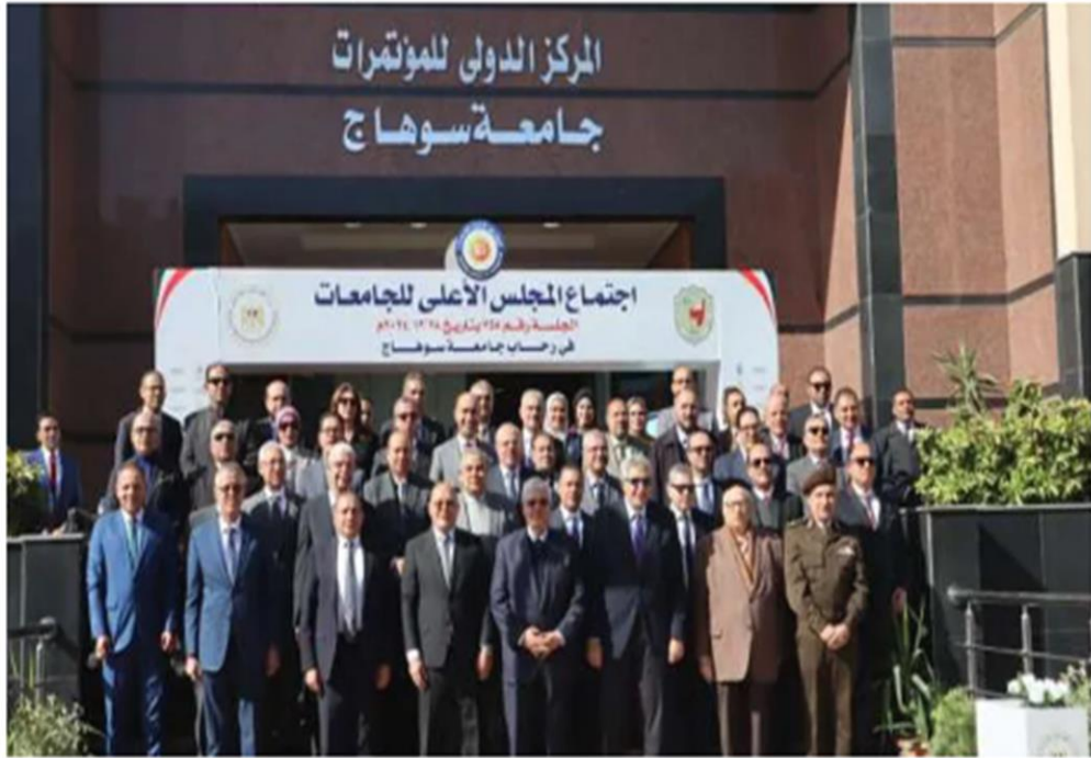
جانب من حضور الاجتماع

https://www.elwatannews.com/news/details/7757969#goog_rewarded