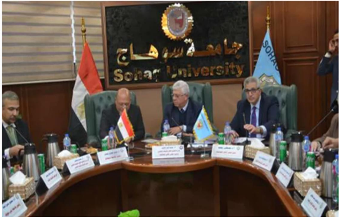
المجلس الأعلى للجامعات

https://www.elwatannews.com/news/details/7759103