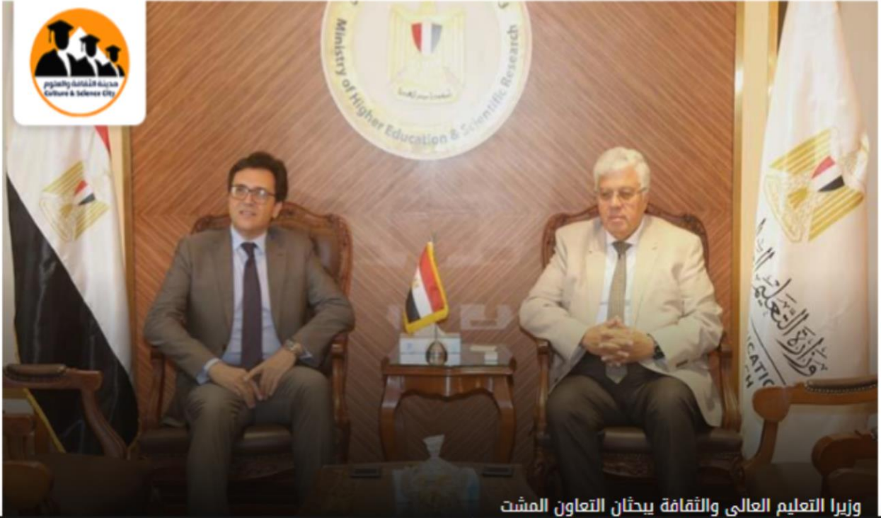
وزيرا التعليم العالي والثقافة يبحثان التعاون المشت