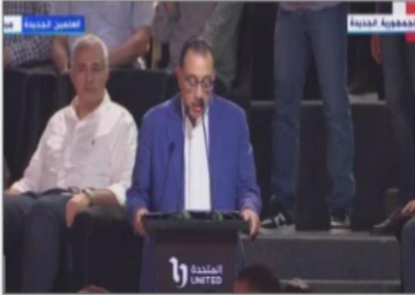
رئيس الوزراء من رالى مهرجان العلمين

https://www.youm7.com/story/2024/8/15/%D8%B1%D8%A6%D9%8A%D8%B3-%D8%A7%D9%84%D9%88%D8%B2%D8%B1%D8%A7%D8%A1-%D9%8A%D8%B4%D9%83%D8%B1-%D8%A7%D9%84%D8%B4%D8%B1%D9%83%D8%A9-%D8%A7%D9%84%D9%85%D8%AA%D8%AD%D8%AF%D8%A9-%D8%B9%D9%84%D9%89-%D8%AA%D9%86%D8%B8%D9%8A%D9%85-%D8%B1%D8%A7%D9%84%D9%89-EVER-%D8%A8%D9%85%D9%87%D8%B1%D8%AC%D8%A7%D9%86/6675565