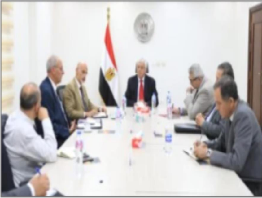
جانب من الإجتماع

https://www.youm7.com/story/2024/8/29/%D9%88%D8%B2%D9%8A%D8%B1-%D8%A7%D9%84%D8%AA%D8%B9%D9%84%D9%8A%D9%85-%D8%A7%D9%84%D8%B9%D8%A7%D9%84%D9%89-%D9%8A%D8%A8%D8%AD%D8%AB-%D9%85%D8%B9-%D8%B1%D8%A6%D9%8A%D8%B3-%D9%87%D9%8A%D8%A6%D8%A9-%D8%A7%D8%B9%D8%AA%D9%85%D8%A7%D8%AF-%D8%A7%D9%84%D8%AC%D9%88%D8%AF%D8%A9-%D8%A7%D9%84%D8%A7%D8%B3%D9%83%D8%AA%D9%84%D9%86%D8%AF%D9%8A%D8%A9/6689623