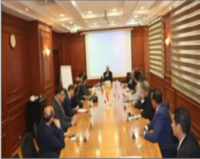
معهد اعداد القادة

https://www.youm7.com/story/2024/8/24/%D8%AE%D8%AA%D8%A7%D9%85-