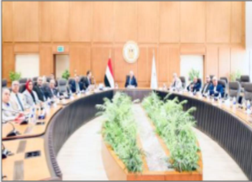
اجتماع مجلس إدارة الاتحاد الرياضي للجامعات

https://www.youm7.com/story/2024/8/20/%D9%88%D8%B2%D9%8A%D8%B1-