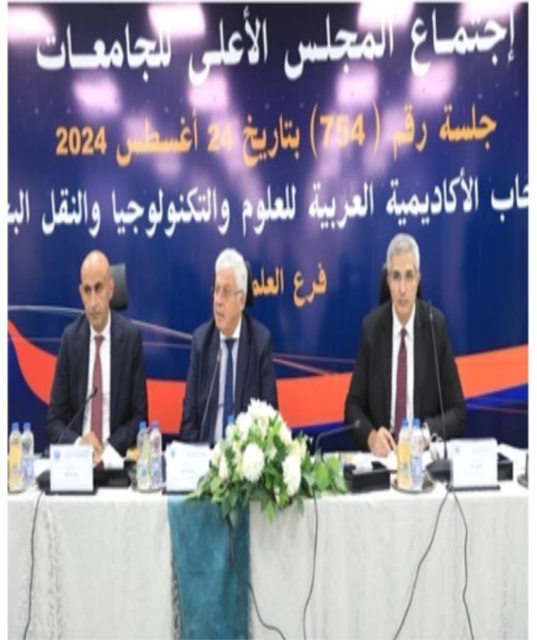
جانب من اجتماع المجلس الأعلى للجامعات