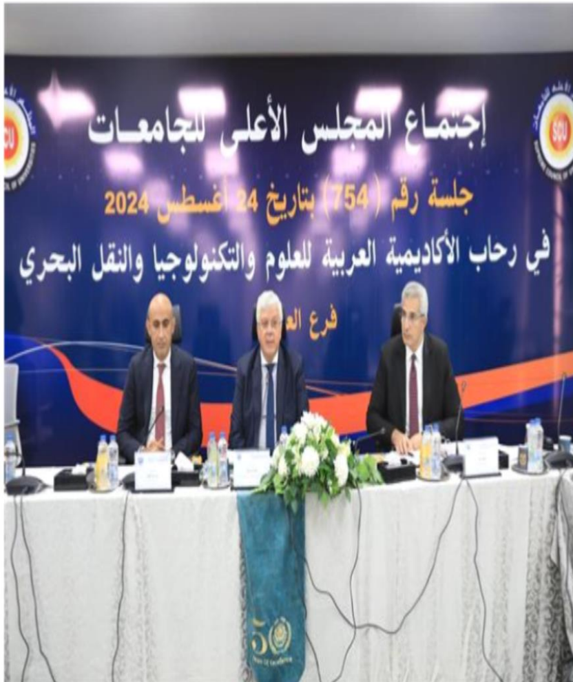
حائب من الاجتماع